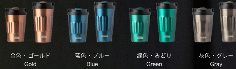
金色・ゴールド Gold 蓝色・ブルー Blue 绿色・みどり Green 灰色・グレー Gray

レトロなデザイン。ハンドル付きタンブラー、外に持ち出しやすい。 Retro Design. Tumbler with handle, easy for taking outside.