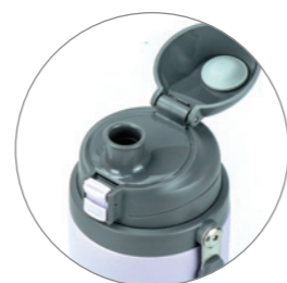
跳ねるふた飲みやすい Bouncing Lid Easy to drink

内胆材質: 304不銹鋼(SUS304) 内側材質: 304 ステンレス鋼 (SUS304) Inner: 06Cr19Ni10 (SUS304)