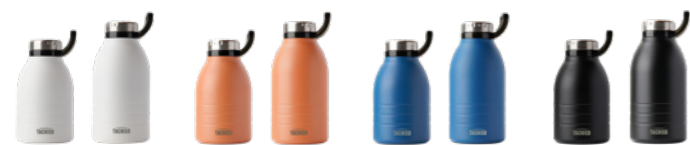
白色・白 White 橙色・オレンジ Orange 蓝色・ブルー Blue 黑色・くろ Black

持ち運びに便利な取っ手付きスポーツボトル、中にストロー付き。 Sports bottle with handle, easy for carrying, with straw inside.