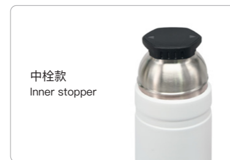
中栓款 Inner stopper

内胆材质: 304不锈钢(SUS304) 杯盖: PC树脂/PP树脂+ABS树脂+SUS304 内側材質: 304 ステンレス鋼 (SUS304) ふた: PC樹脂/PP樹脂+ABS樹脂+SUS304 Inner: 06Cr19Ni10 (SUS304) Lid: PC/PP+ABS+06Cr19Ni10 (SUS304)