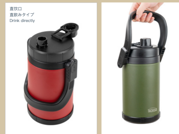
直飲口 直飲みタイプ Drink directly

颜色: 颜色支持定制 カラー: 色は指定することができる Regular Color: Color support customization