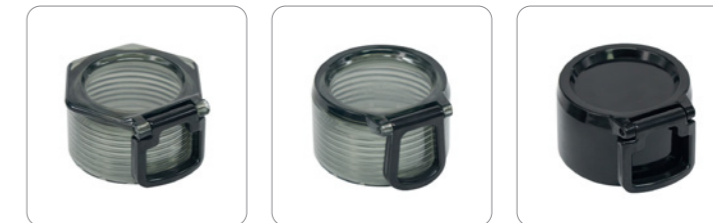
杯盖1 LID1 杯盖2 LID2 杯盖3 LID3